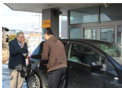
notteco を利用する天塩町民