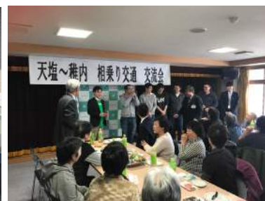
ドライバーと同乗者の交流会