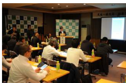
町民向けの会員登録会

notteco は実証実験期間中の約 7 か月間、サービスの説明会や会員登録会、町民との意見交換会や家庭訪問による状況把握などを実施し、利用者の声を吸い上げながら、天塩町と稚内間の交通手段の一つとして定着するよう、町と協力してきました。(2017 年 10 月 25 日現在までの実証実験期間中の実績：登録ドライブ件数 289 件、利用者数延べ 155 人。) 今では 1 日 1 便は往復ができるようなドライブ予定が登録されており、実質上の「定期便」ができ、町民からも「notteco がなくなったら町から引っ越ししなくてはならない」という声も上がってきたことを受け、11 月 1 日(水)より本格始動に至りました。